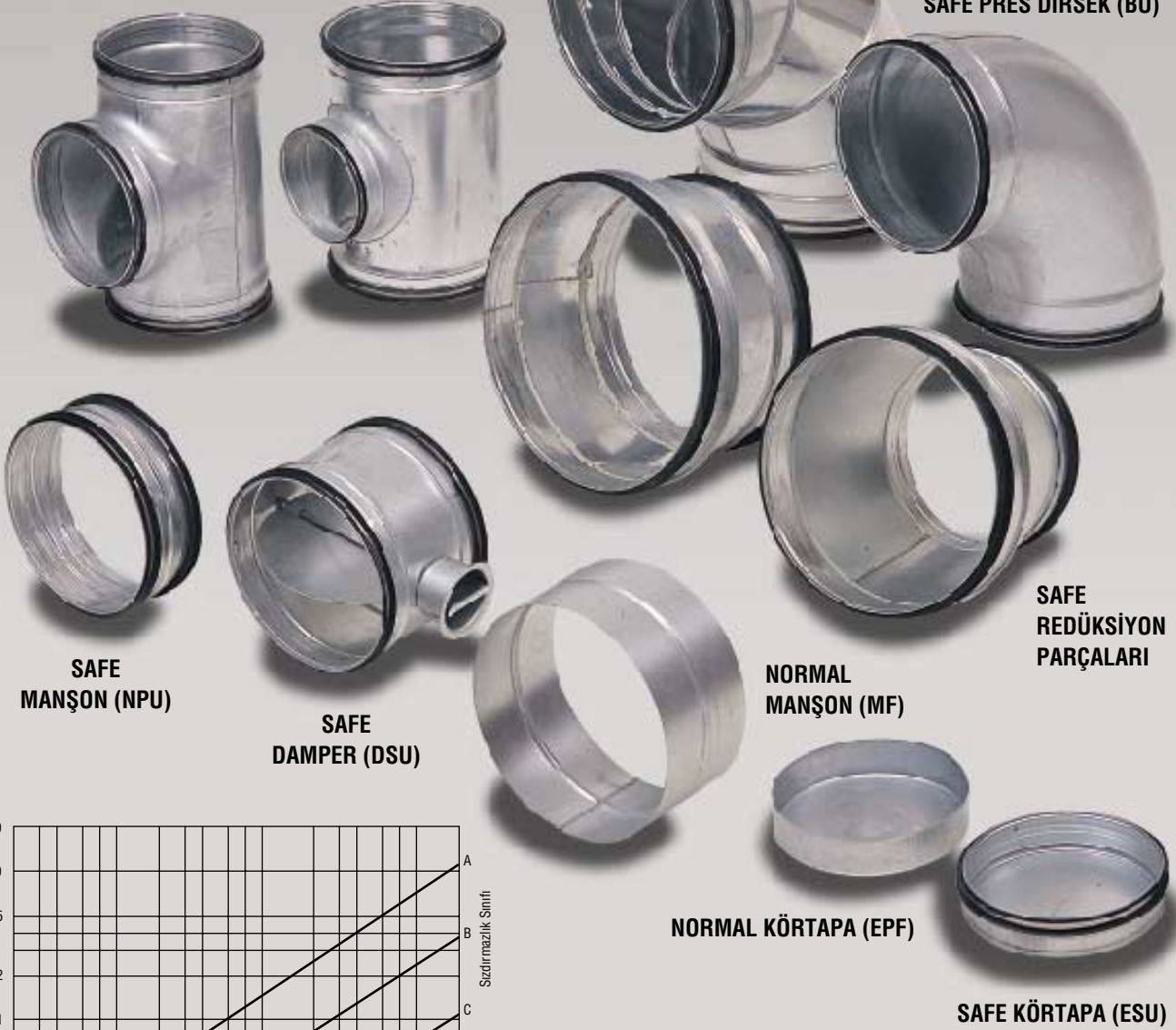
SAFE MANŞON (NPU)